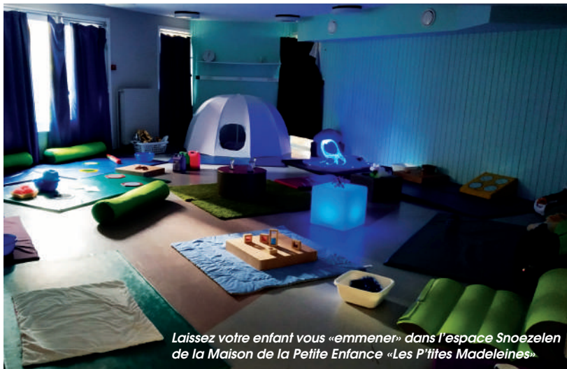
Laissez votre enfant vous «emmener» dans l'espace Snoezelen de la Maison de la Petite Enfance «Les P'tites Madeleines»