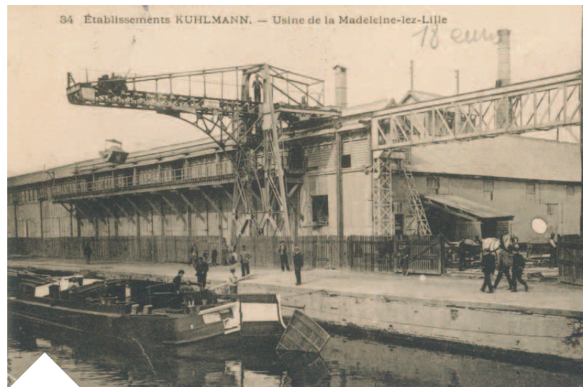
L'usine Kuhlmann dans les années 1910

La main-d'œuvre de l'industrie textile était essentiellement féminine. Après la Seconde Guerre mondiale, cette main d'œuvre était de plus en plus éloignée géographiquement et des recrutements furent réalisés jusque dans le bassin minier.